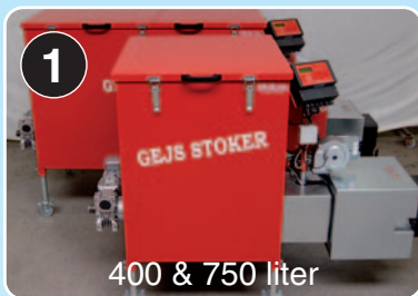
400 & 750 liter