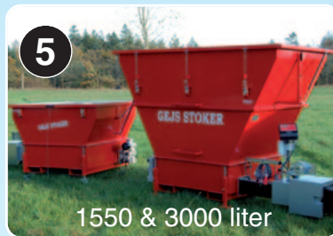
1550 & 3000 liter