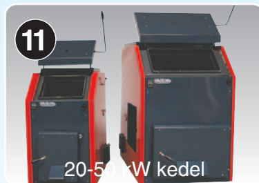
20-50 kW kedel