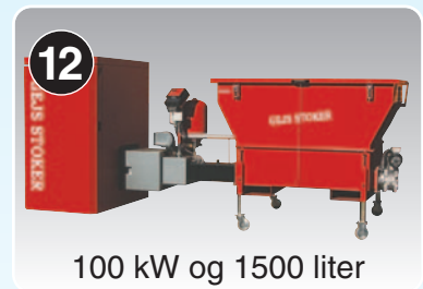
100 kW og 1500 liter