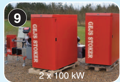
2 x 100 kW