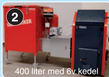
400 liter med 6v kedel